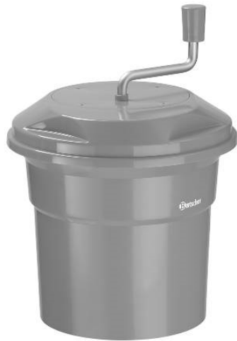
K1-12L / 120710