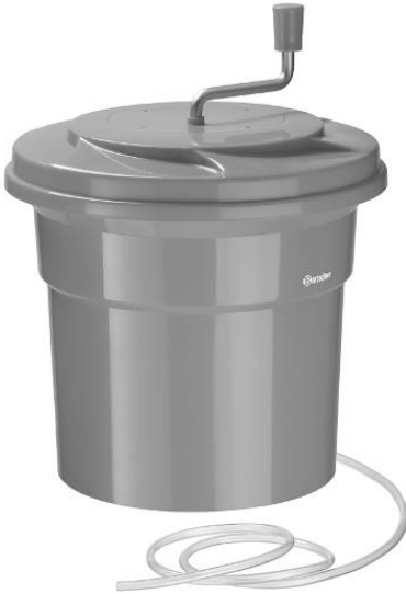
K1-25L / 120709